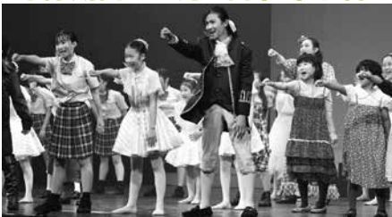
※2021年公演「さよなら、モーツァルト!」より