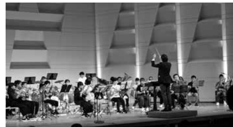
昨年の様子:大井川ジュニア吹奏楽教室

小学生から社会人まで、幅広い年代の吹奏楽団体が出場する音楽の祭典「ミュージコ吹奏楽フェスティバル」を開催します。コロナ禍の中でも、音楽で旅行気分を満喫できるように今回のテーマは、「旅行」。各団体の特徴ある演奏で楽しい時間をお過ごしください。